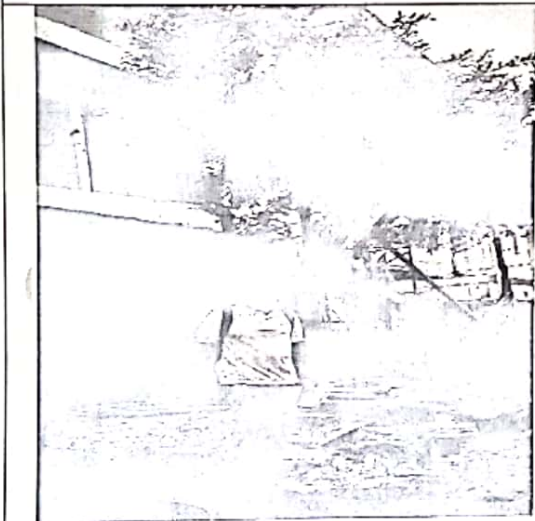
Foto3. Verificación de la zona de riesgo