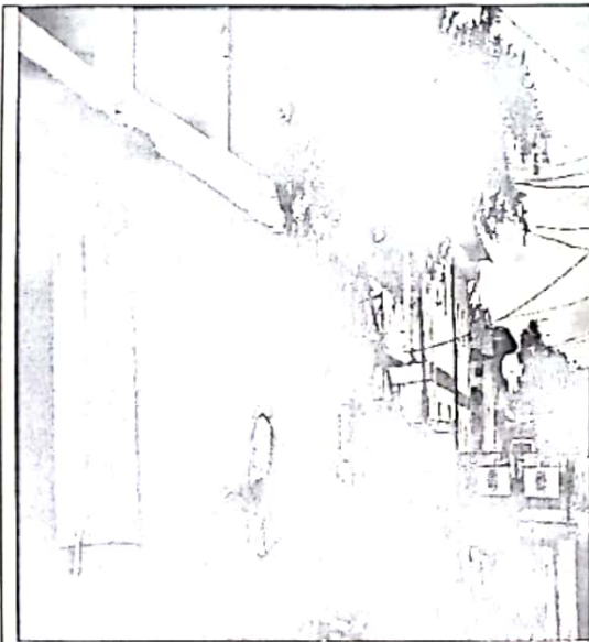
Foto1. Apertura de la visita, localizando el área.