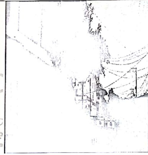
Foto4. verificación estado fitosanitario del árbol

En el desarrollo de la visita se pudo corroborar que, por su estado de peligrosidad debido a la cercanía de los árboles a la calle, es conveniente realizar la tala del arbusto de manera urgente, ya que representan un peligro inminente para las personas que transitan por el lugar, tal como lo podemos apreciar en las imágenes anterior.