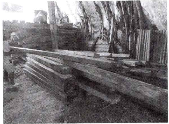
Foto 2. Descargue del material forestal.