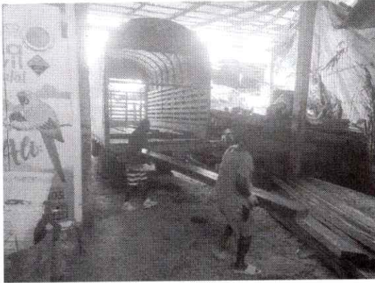
Foto 1. Descargue del Material forestal incautada por la Armada Nacional entregado a la autoridad ambiental – CODECHOCO.