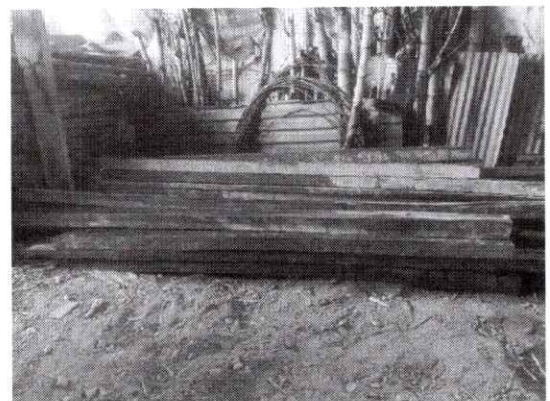
Foto 2. material forestal descargado