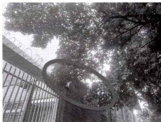
Foto 2. Imagen de ramas que permiten la entrada de delincuentes