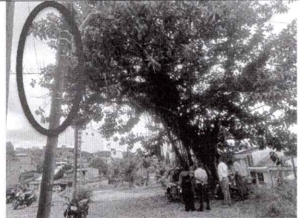
Foto 4 árbol cerca del sistema de cableado eléctrico.

En el desarrollo de la visita se pudo corroborar que, por la altura que tienen los árboles y la gran cantidad de follaje que presenta, se hace necesario realizar una poda a las especies de Ficus glabrata y ficus elástica , debido a que se evidencio que generan alto riesgo para la INSTITUCION EDUCATIVA ARMANDO LUNA ROA y los habitantes del área, ya que se ha evidenciado que por sus grandes ramas se hace fácil que los delincuentes ingresen a la institución, además algunas ramas están tocando con el sistema de cableado eléctrico lo que pone en riesgo la seguridad de los estudiantes que son menores de edad a los cuales se les pretende conservar la integridad física.