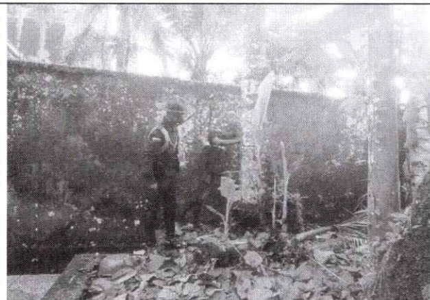
Foto 3. Palma objeto de tala