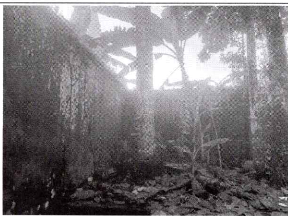
Foto 4. Palma objeto de tala

En el desarrollo de la visita se pudo corroborar que, por la ubicación se hace necesario realizarle tala a cada a esta sp, ya que, su raíz está muy expuesta y además ya existe antecedentes de otros árboles que sufrieron volcamiento, generándoles afectaciones directas.