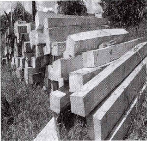
Foto 1 y 2 Descargue y acopio de la madera incautada en predios de la estación de policía en Curbarado.