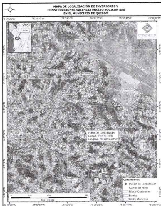
Mapa 1. Ubicación geográfica del proyecto