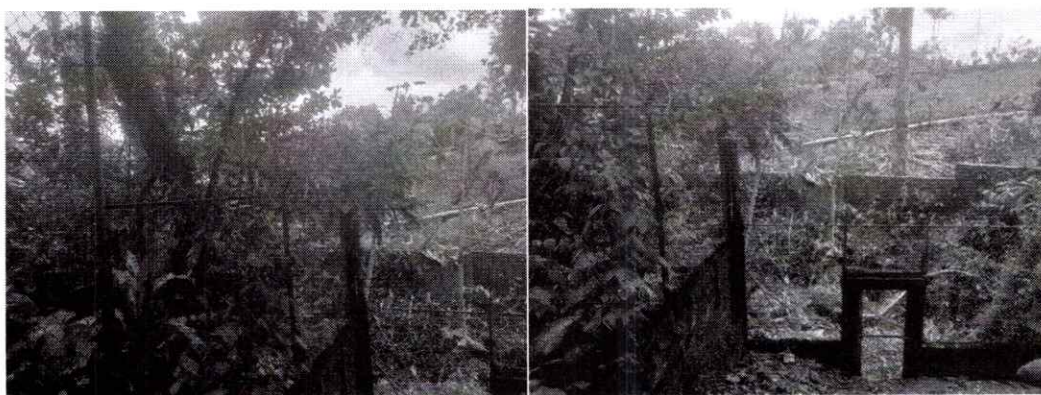
Imagen 1, 2 y 3. Registro fotográfico del área donde se encuentra el árbol de Marañón.