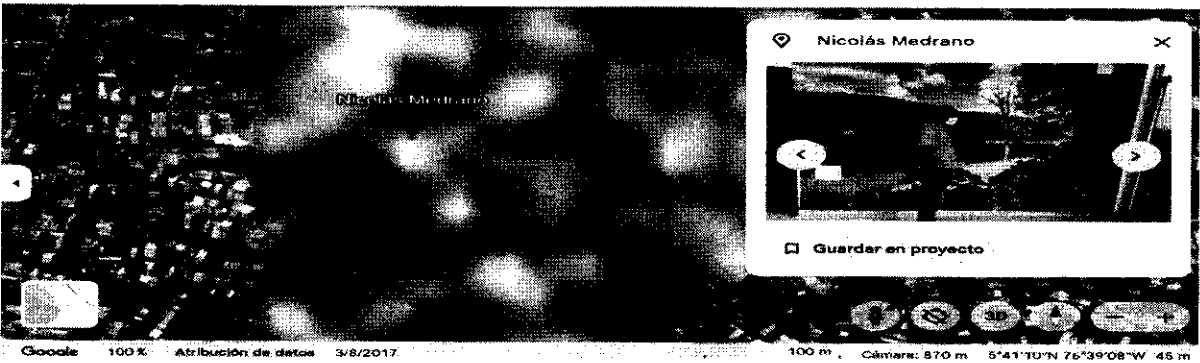
Imagen 1. Localización, Ancianato Nicolás Medrano, sitio donde se encuentran los árboles.