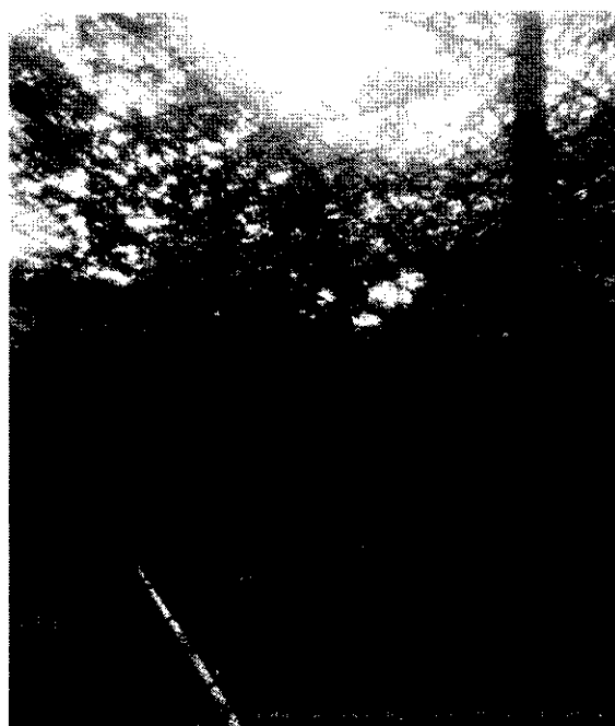
Imagen 2, 3, 4, 5, 6 y 7. Registro fotográfico de la Situación encontrada.