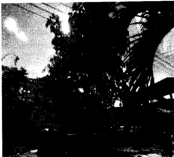
Imagen 2 y 3. Registro fotográfico de la Situación encontrada.