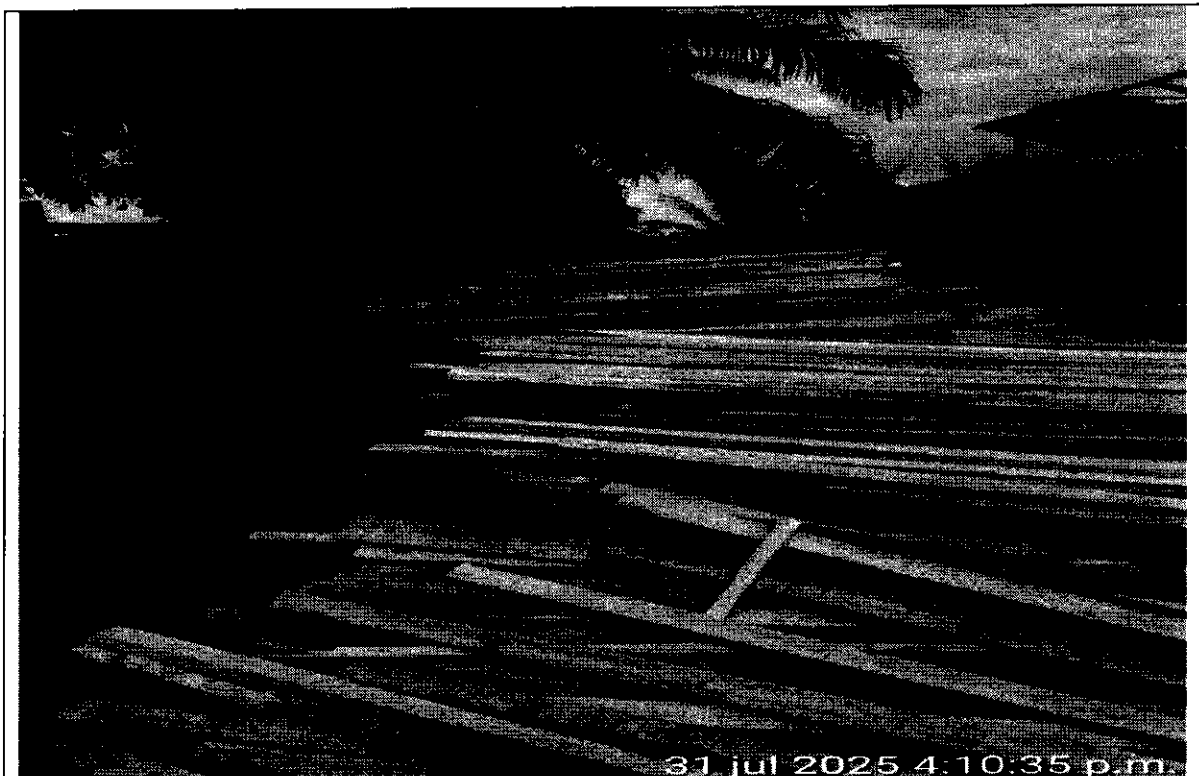
Foto 1: Vista de la madera (tablillas) incautadas de la especie Lechero

Lugar: Base militar, Batallón selva 54 frente al aeropuerto de Riosucio, en la vía que conduce de este a Belén de Bajira