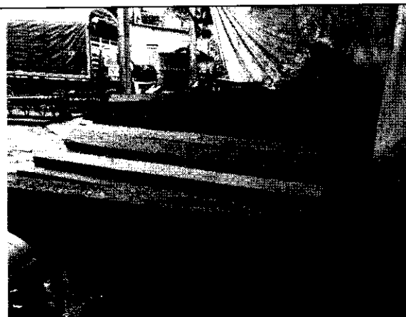
Foto 3. Medición del bloque de madera para determinar el volumen.