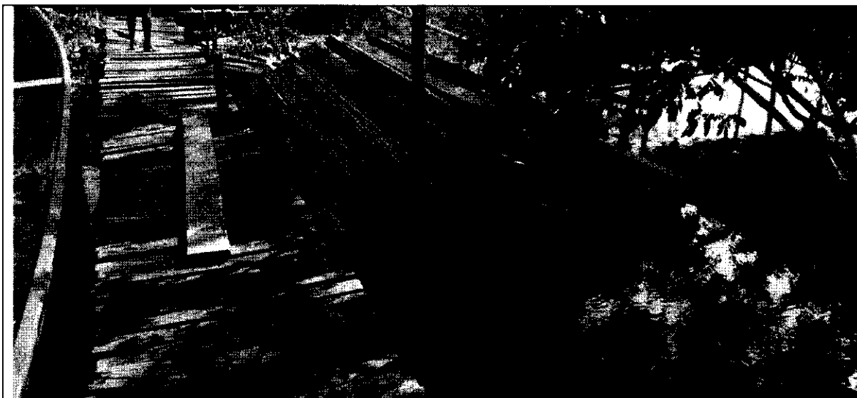
Foto 1: Maderas incautadas de la especie Choiba Lugar: Puente América, y en acopio de Villa Rufina Riosucio Chocó Fecha: 18 de julio de 2025