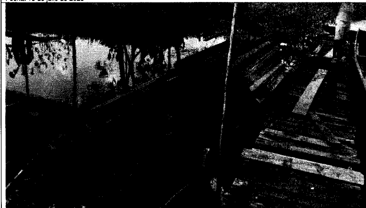
Foto 1: Vista de la madera incautadas de la especie Choiba Lugar: Puente América, y en acopio de Villa Rufina Riosucio Chocó Tomo: Luis Ademir Cuuesta Lemos Fecha: 18 de julio de 2025