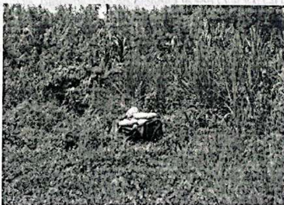
Imagen 2. Área donde se encuentra el pozo séptico