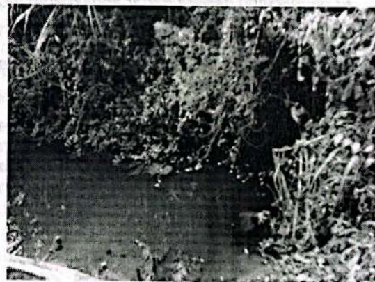
Imagen 3. Descole y/o salida del pozo séptico