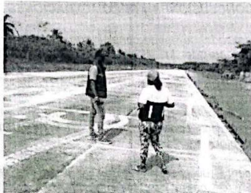
Imagen 1. Visita al Consorcio Aerojurado 2018