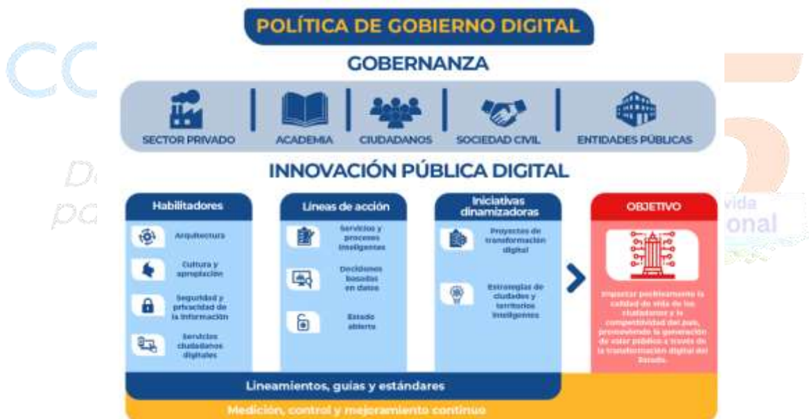
Ilustración 1. Política de Gobierno Digital

En ese orden de ideas y teniendo en cuenta que CODECHOCO es una entidad del estado; debe acogerse a las políticas nacionales, como lo es la Política de Gobierno Digital – PGD, liderada por el Ministerio de las Tecnologías de la Información y las Comunicaciones – MINTIC, que busca promover el uso y apropiación de las tecnologías de la información y las comunicaciones, dentro de un entorno digital seguro; mediante el siguiente esquema para su habilitación: